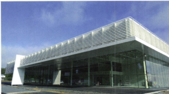
Glasfassade und Stahlstreben als Merkmale © Vulsteke Industriebouw, Kortemark

The Coating Company Holding GmbH 57072 Siegen www.coatinc.com