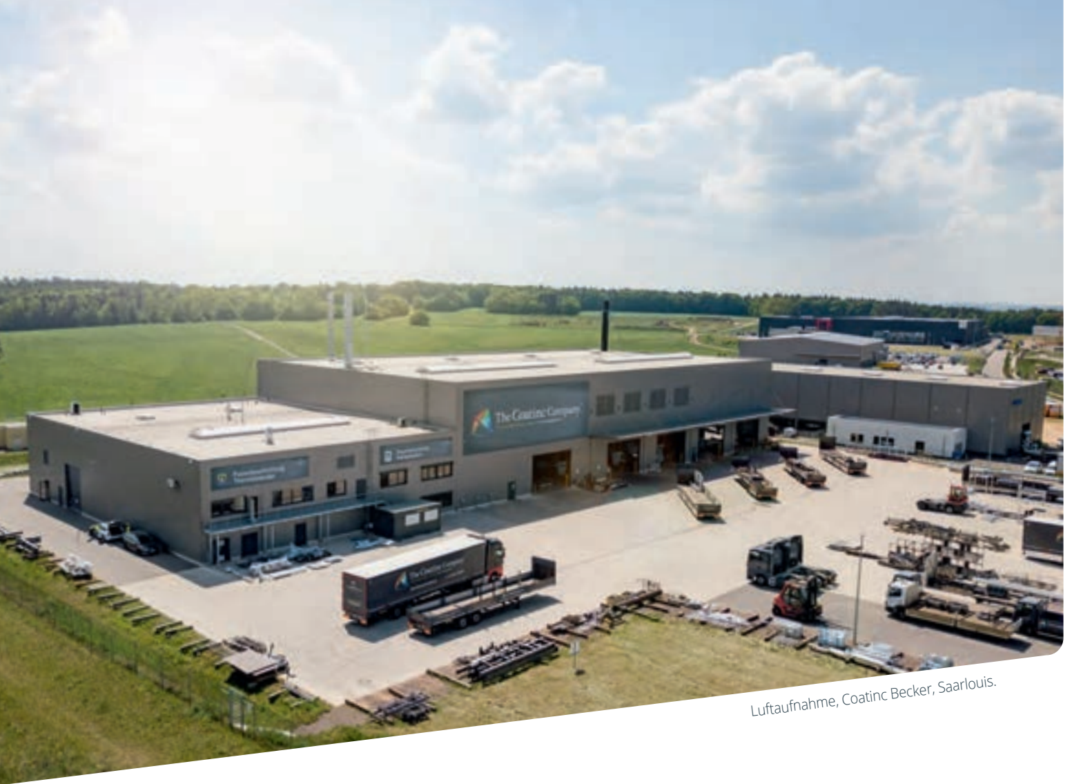
Luftaufnahme, Coatinc Becker, Saarlouis.