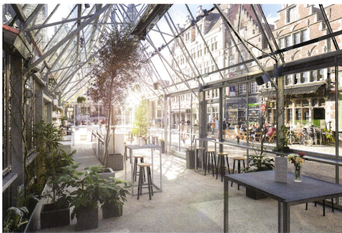
Orangerie von innen